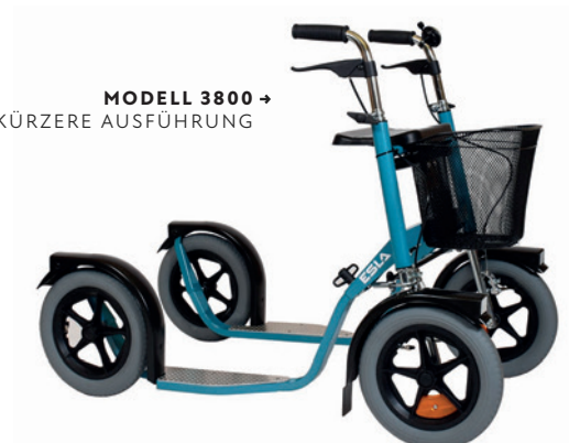
MODELL 3800 → KÜRZERE AUSFÜHRUNG

Der Esla Doppelroller ermöglicht mehr Bewegungsfreiheit. Die Sicherheit sowie die Eigenschaften zur Steigerung und Erhaltung der Fitness machen den Doppelroller zu einem beliebten Sportgerät für Menschen jeden Alters und Fitnesslevels. Gut geschützte Trommelbremsen funktionieren auch bei Regen und Frost zuverlässig. Dank der nach unten auslaufenden Dreieckskonstruktion des vorderen Rahmens schert der Roller auch beim Bremsen mit nur einem Bremsgriff nicht aus. Der Esla Doppelroller lässt sich leicht fahren und dient das ganze Jahr über als sicheres Fortbewegungsmittel. Im Lieferumfang ist ein großer Korb (23 l) enthalten.