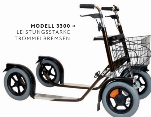
MODELL 3300 → LEISTUNGSSTARKE TROMMELBREMSEN

Dank der großen Gummireifen (Ø 31 cm) bewegt sich der Esla Doppelroller leicht auf allen Straßen. Er verfügt über langlebige Nabenbefestigungen für Reifen und Felgen. Die nach unten auslaufende Dreieckskonstruktion des vorderen Rahmens und die doppelte Lenkerstange gewährleisten Stabilität und Gebrauchssicherheit. Auch wenn sich der Schwerpunkt zum Beispiel bei Kurvenfahrten oder Bremsungen zur Seite verlagert, bleibt die Lenkung stabil. Die Montage ist einfach und ohne Werkzeug möglich. Der Doppelroller passt auch gut in kleinere Räume.