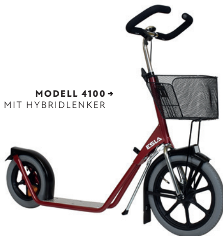
MODELL 4100 → MIT HYBRIDLLENKER

Der automatische Ständer klappt aus, wenn die Lenkerstange bis an den Anschlag gedreht wird. Zum Einklappen die Lenkerstange wieder in die Fahrposition drehen. Die Belastbarkeit des Gepäckkorbs beträgt bis zu 20 kg und auch im beladenen Zustand bleibt der Tretroller aufrecht.