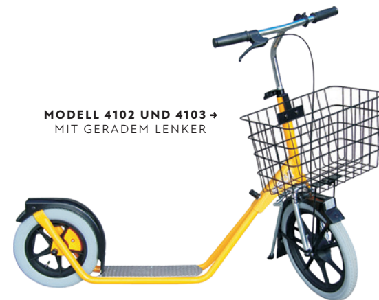
MODELL 4102 UND 4103 → MIT GERADEM LENKER

Der gepolsterte Hybridlenker kann in drei Grundpositionen eingestellt werden. Der vordere und hintere Rahmen können bei Bedarf gelöst werden, um den Roller für den Transport platzsparend zu verstauen.